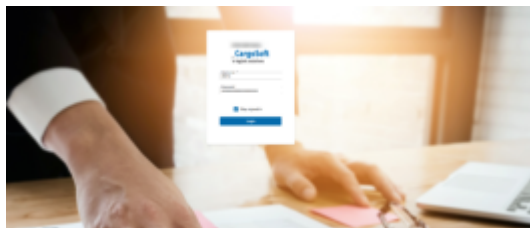
Bilden eines All-In-Preises